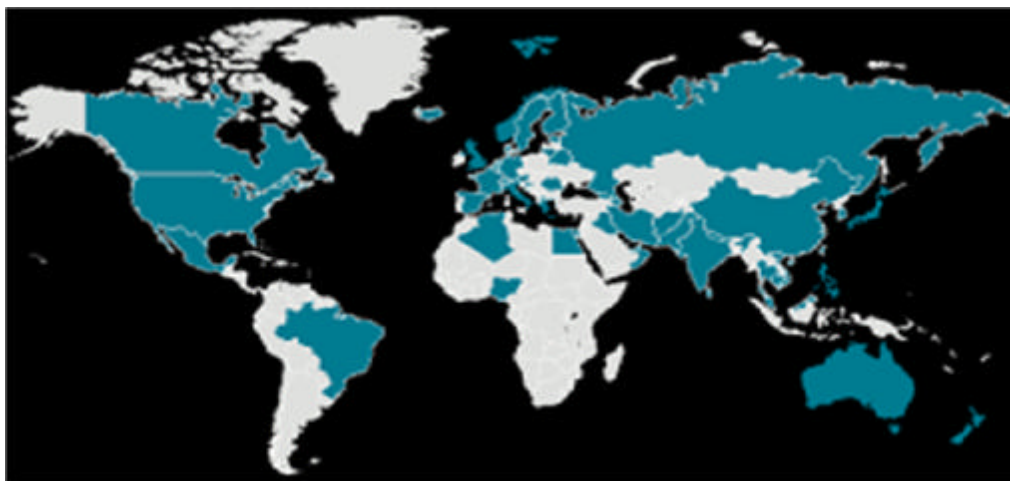
شکل شماره ۱ - میزان درگیری کشورها و مبتلایان به بیماری کووید ۱۹، در مارس ۲۰۲۰ (۱۸)

جهان، با میزان پراکندگی مطابق با شکل شماره ۱ یک، مشاهده شده است و تا این تاریخ، ده کشور نخست از نظر تعداد مبتلایان به بیماری کووید ۱۹، به ترتیب، چین، ایتالیا،